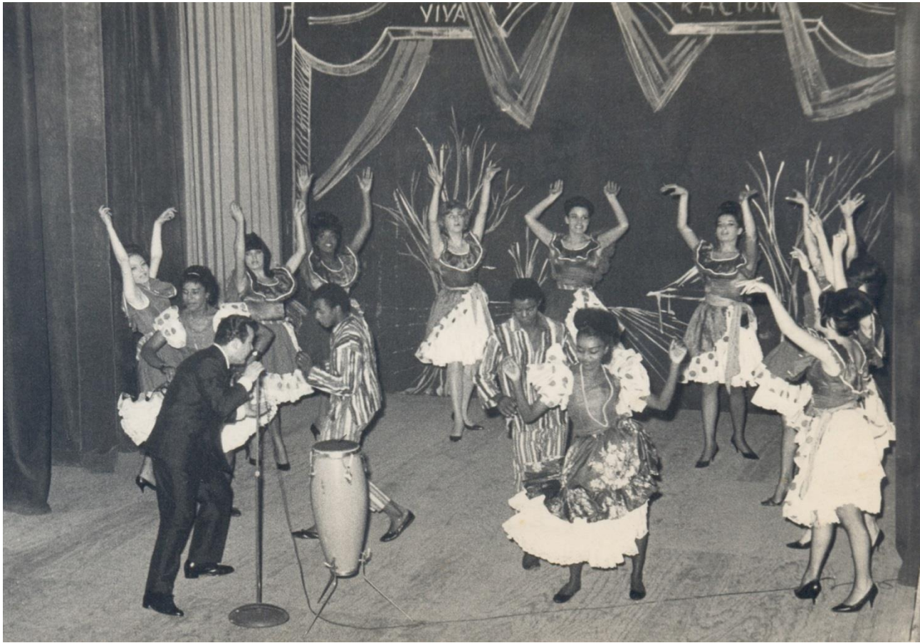
Show de Alberto Castillo con candomberos afroporteños. Rosario (Santa Fe), ca. 1970. Los afros -casi todos aún vivos- son de la familia Garay, Córdoba y Lamadrid en cuya casa, en Flores, funcionó hasta 1952 Centro Recreativo La Armonía, fundado en 1917. Allí se bailaba tango de la Guardia Vieja.