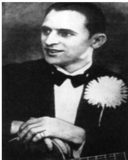
Piotr Leshchenko, "el rey del tango ruso" alcanzó celebridad mundial en 1935 con "Serditse"

Melodía de Arrebal (es una película dirigida por Louis Gasnier, con guion de Alfredo Lepera. Fue filmada en Joinville, Francia en 1932. En el film Carlos Gardel interpreta a un malandrín que vive en cafetines de arrabal haciendo trampas en el juego y con la vocación escondida (berretín, en lenguaje lunfardo) de cantor de tangos. Un día conoce a Alina (Imperio Argentina), una profesora de canto que lo oye cantar y le aconseja dedicarse profesionalmente, prometiéndole su ayuda y alguna recomendación. La historia se complica cuando el protagonista mata a un conocido del hampa que amenaza con delatar su mal vivir a Alina. La película se estrenó con gran éxito en Buenos Aires y en todos los países hispanohablantes trascendiendo las fronteras naturales del idioma al emitirse en otros países en diferentes idiomas como en Portugal, Brasil, Francia, Italia e incluso en África, tal como cual lo atestiguan diferentes carteles publicitarios de la época promocionando el film.).