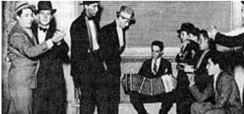
Buenos Aires cerca del 1910 Jóvenes trabajadores bailan tango entre hombres y escuchan a un bandoneonista en la vereda.