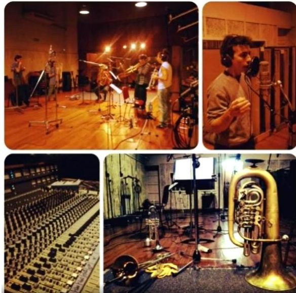
Así suena Civenti en manos de RaRa HaviS Producido por Gustavo Trillini.